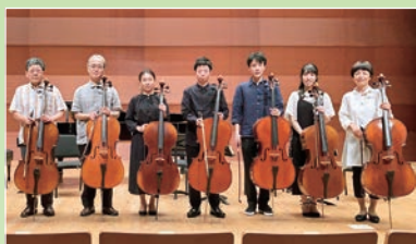
日曜アンサンブル (チェロアンサンブル)

一般公募で選ばれた7団体が、京都コンサートホール アンサンブルホールムラタのステージで演奏します。 プロ・アマ、音楽ジャンル問わず奏でられる音楽リレー！さあ、みんなでバトンを受け取りましょう！