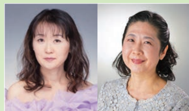
デュオ Duo すずらん (ヴァイオリンとピアノのデュオ)

R.シューマン：3つのロマンス 作品94より 第2番 C.シューマン：3つのロマンス 作品22