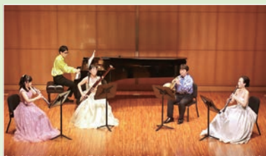
リーベン クインテット Lieben Quintett (ピアノと管楽器の五重奏)

R.シューマン：3つのロマンス 作品94より 第2番 C.シューマン：3つのロマンス 作品22