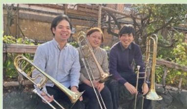
京都リオ (トロンボーントリオ)